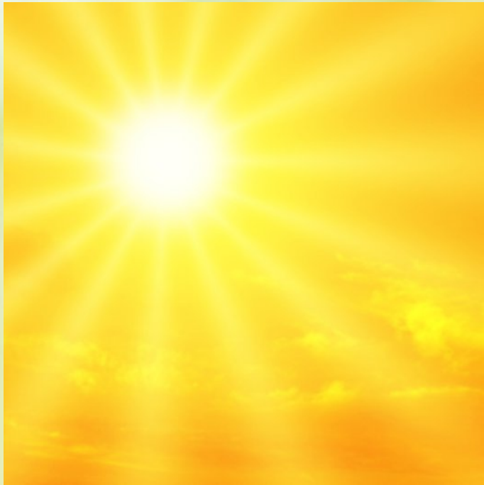
Immobilien - Revitalisierung